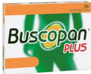
Buscopan PLUS* 20 Filmtabletten