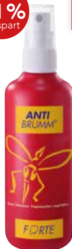
ANTI BRUMM FORTE* 75 ml