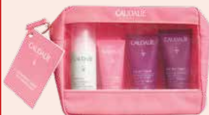
CAUDALIE Sommer Reiset 1 Stück