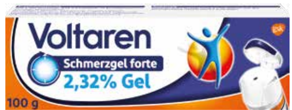
Voltaren Schmerzgel forte* 100 g