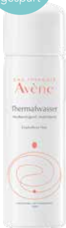
Avène Thermalwasser 50 ml