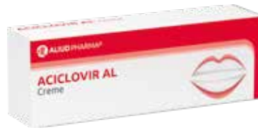
ACICLOVIR AL Creme* 2 g