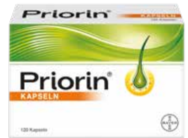
Priorin* 120 Kapseln