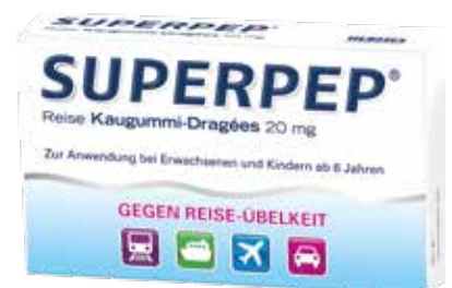
SUPERPEP Reise Kaugummi-Dragees* 10 Kaudragees

*Zu Risiken und Nebenwirkungen lesen Sie die Packungsbeilage und fragen Sie Ihren Arzt oder Apotheker.