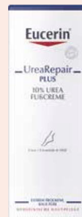
Eucerin UreaRepair PLUS 10 % UREA FUBCREME 100 ml