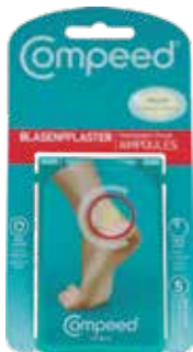
Compeed BLASENPFLASTER MEDIUM 5 Blasenpflaster