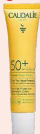
CAUDALIE Vinosun LSF 50+ 40 ml