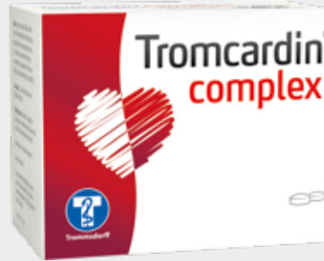
Tromcardin complex* 180 Filmtabletten