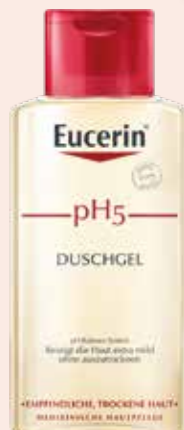
Eucerin pH5 DUSCHGEL 200 ml