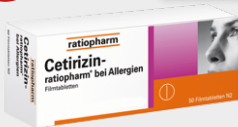
Cetirizin- ratiopharm bei Allergien* 50 Filmtabletten