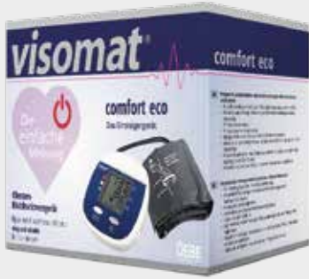
visomat comfort eco 1 Blutdruckmessgerät