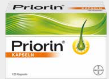
Priorin* 120 Kapseln