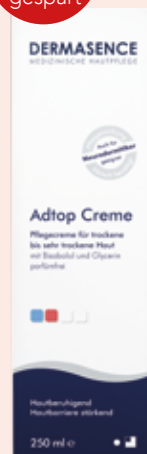
DERMASENCE Adtop Creme 250 ml