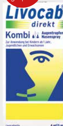
Livocab direkt Kombi* 1 Kombi-Packung

*Zu Risiken und Nebenwirkungen lesen Sie die Packungsbeilage und fragen Sie Ihren Arzt oder Apotheker.