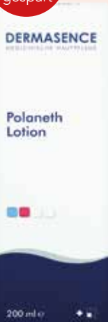
DERMASENCE Polaneth Lotion 200 ml